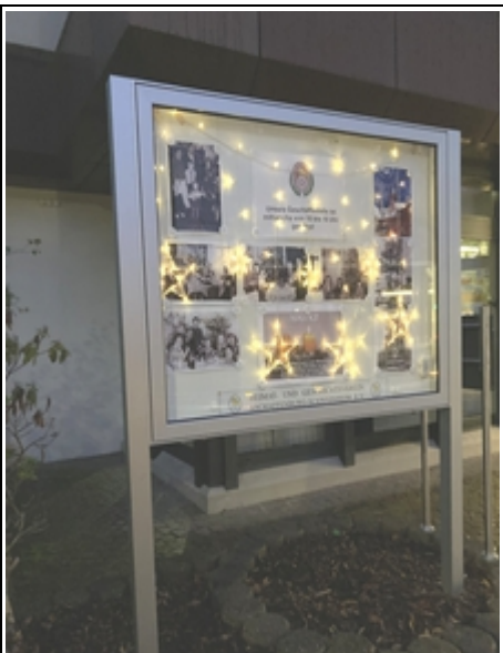
Unser Schaukasten in der Hensbachstraße ist weihnachtlich dekoriert.

Siehst du die Lichter nicht und den Glanz? Es brennen doch schon alle Kerzen am Kranz! Wenn nicht in uns ein Lichtlein brennt, dann bleibt es dunkel, auch im Advent! Jeder hilft jedem, so gut er kann. Dann gehen viele Lichter an!