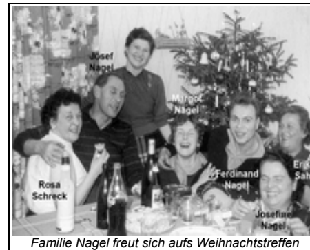
Familie Nagel freut sich aufs Weihnachtstreffen