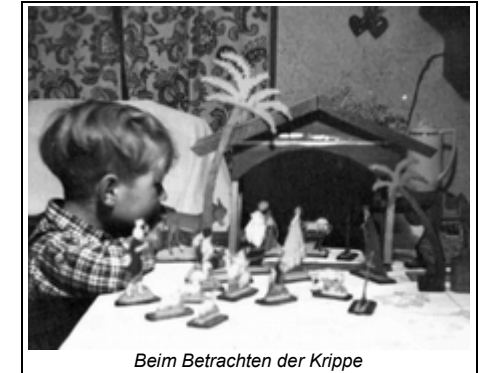
Beim Betrachten der Krippe