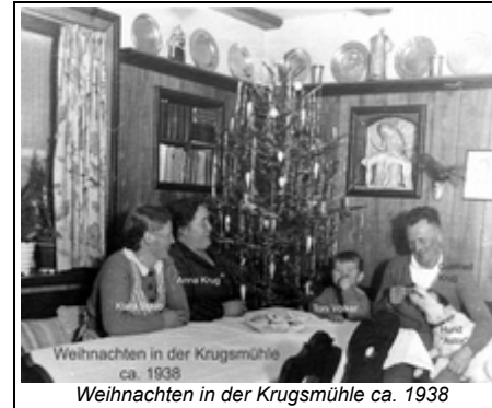
Weihnachten in der Krugmühle ca. 1938