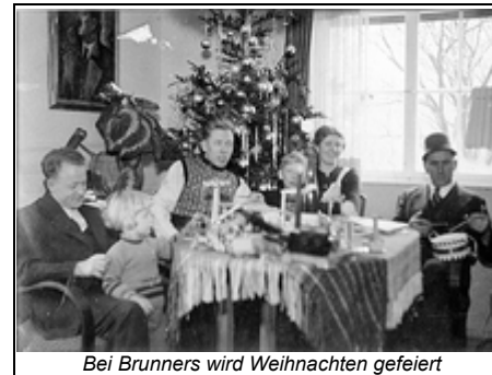
Bei Brunners wird Weihnachten gefeiert