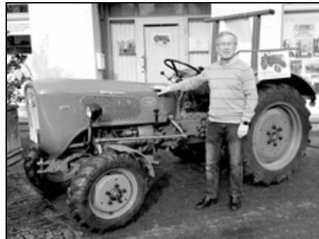
Der Vorsitzende am „Blickfang“