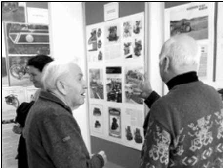
Ex-Güldner Kollegen erinnern sich