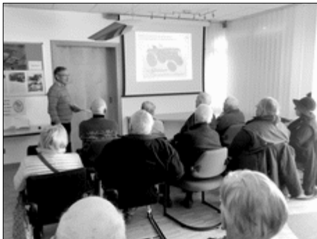
Alle Stühle in der Geschäftsstelle waren besetzt