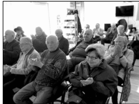
Applaus am Ende des Vortrages