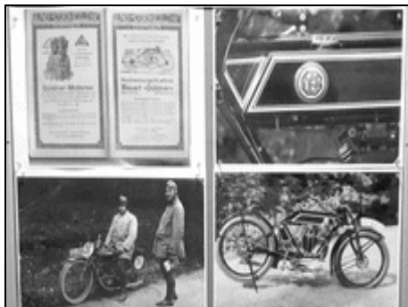
Es wurden auch Güldner Motorräder gebaut