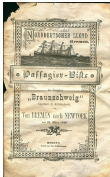
Deckblatt der Passagierliste