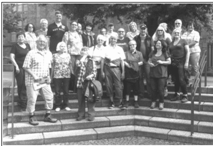
Unten: Abschlussfoto auf der Treppe vor der Kirche Maria Geburt.