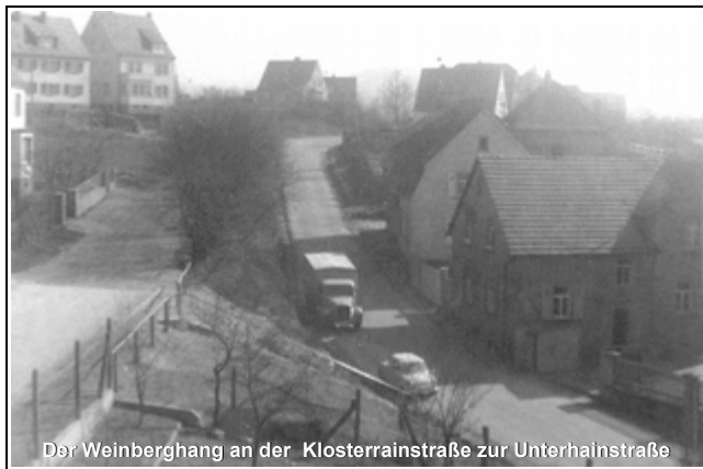
Der Weinberghang an der Klosterrainstraße zur Unterhainstraße

Im Schatzungsbuch von Schweinheim aus dem Jahre 1686 wurden die Felder nach Art ihrer Bebauung, ihrer Lage und Größe und nach ihrem Ertragswert angegeben. Unterschieden wurde nach guten, mittleren und schlechten Wingert (Weingärten), Äckern und Wiesen. Die Kappesgärten (Kraut- und Gemüsegärten) sind einheitlich angesetzt, egal in welcher Schweinheimer Flurabteilung sie lagen.