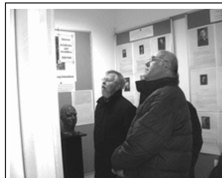
Hochkonzentrierte Suche nach Verwandten.