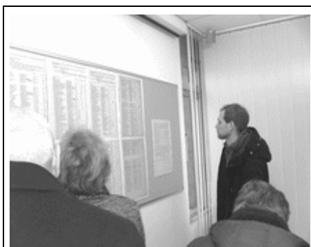
Suche nach Namen der Schweinheimer Soldaten.