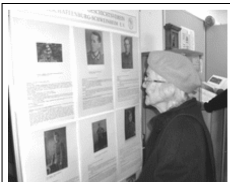
Auf der Suche nach Angehörigen

Am Sonntag, 15. November fand auf dem Schweinheimer Friedhof die alljährliche Totenehrung am Ehrenmal der Gefallenen statt. Der Heimat- und Geschichtsverein