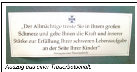
Auszug aus einer Trauerbotschaft.